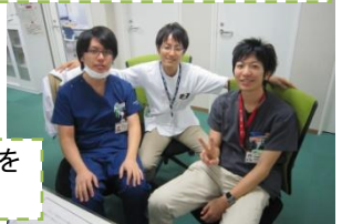
メンターの先生にいろんなことを相談できるから安心♪