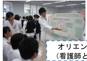
オリエンテーション (看護師と合同のWS)