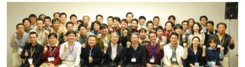
指導医講習会で、熱い指導医がさらに増加中！