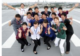
静岡県浜松市 平成27年度～

総合診療内科、救急科、地域研修に加え、外科、麻酔科などの6科が必修で、全般にわたった研修を受けることができます。救急外来日当直を通年実施しているなど、プライマリ・ケアに重点をおいた研修が魅力です。