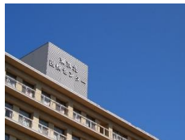
東京都北区 平成28年度～

全国のへき地・離島への医療支援をしていて、総合診療と小児周産期医療に力を入れている病院です。患者数が多く、多忙ながらも充実した研修を受けられます。