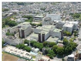
神奈川県川崎市 平成28年度～

臨床研修指導医約170人と万全な指導体制。個々の研修医に合わせた選択性の高い研修スケジュール作成ができます。大学病院でありながら地域の中核病院としても活用されており、初期救急も受け入れています。