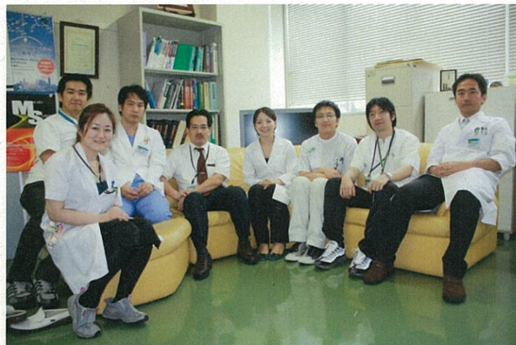
(長崎大学病院から研修にこられた先生を囲んでの1枚)

佐賀大学医学部附属病院では長崎大学、九州大学・福岡大学と連携した専門医育成プログラムに参加しています。長崎大学との交流研修のトップバッターとして形成外科において当院と長崎大学病院の専門研修医の先生が相互の病院に研修に行き、経験を深めています。