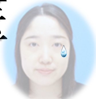
呼吸管理班 原医師