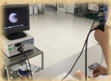
▲ 気管支鏡トレーニング