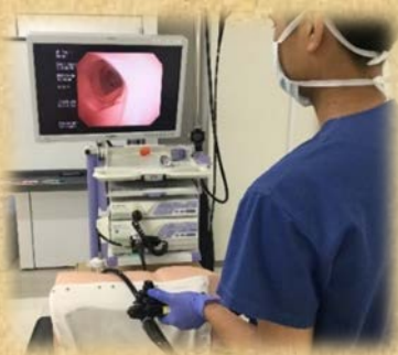
▲ 消化管内視鏡トレーニング