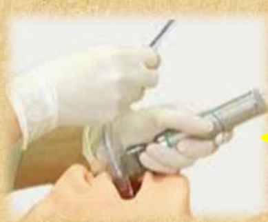
▲ 挿管トレーニング