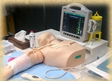
▲ 中心静脈穿刺トレーニング