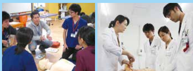
年に数回開催されるICLSコース