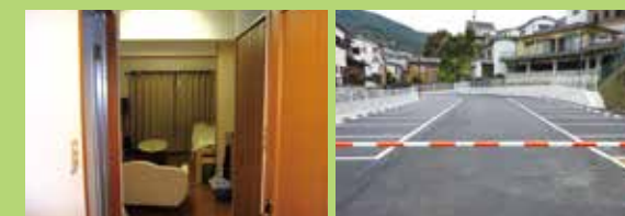
借り上げ宿舎(一例) 研修医専用無料駐車場