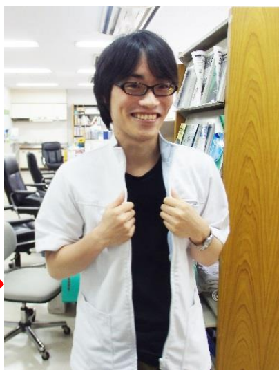
↑白衣に着替えて診察室へ。