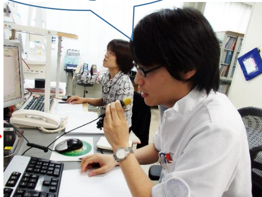
↑患者さんの呼び込みはマイクを使います。