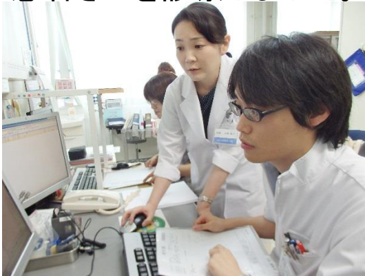
↑電子カルテを書いている様子。