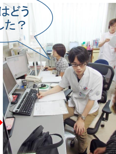
↑さっそく診療スタートです!!!