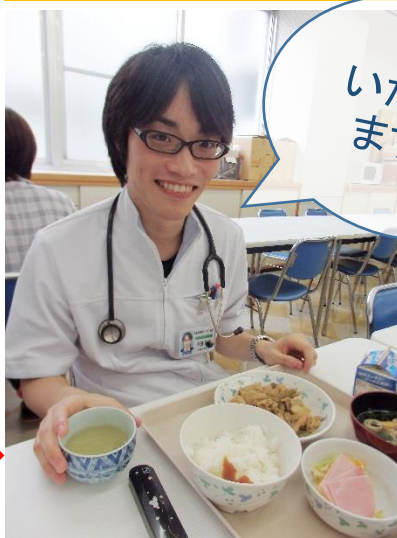
↑北松中央病院の職員食堂で昼食をいただきます。