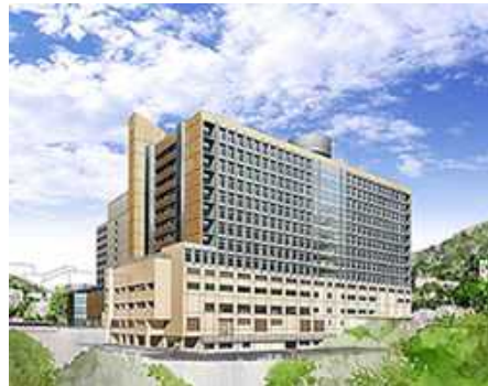
新病棟のスケッチ 平成 20 年 6 月開院 (予定)