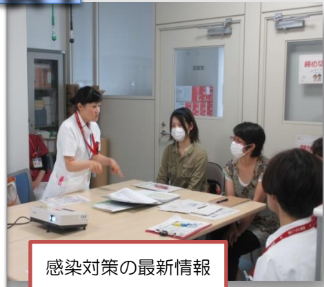
感染対策の最新情報