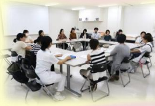
カムバックナースミーティング