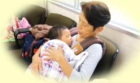
安心の託児 サービス