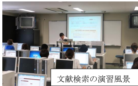
文献検索の演習風景