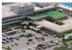
長崎県対馬いづはら病院