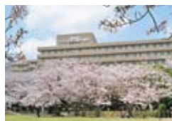
佐世保市立総合病院