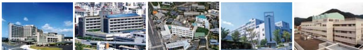
長崎医療センター 長崎原爆病院 長崎北徳洲会病院 佐世保中央病院 長崎県上五島病院