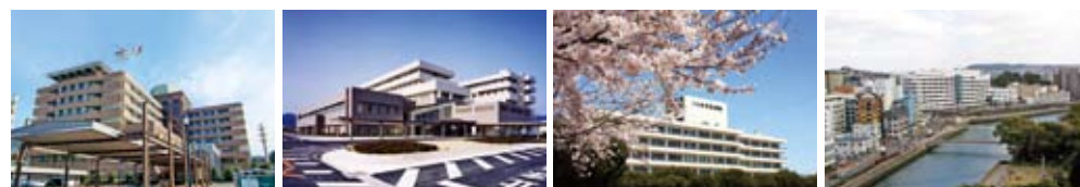
長崎労災病院 長崎県五島中央病院 市立大村市民病院 佐世保共済病院

新・鳴滝塾事務局長。内科医。 平成23年より長崎大学病院 医療教育開発センター教授として 研修教育に従事。