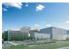
長崎市立市民病院