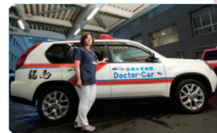
ドクターカー研修もあります

修を行うことが可能です。大学病院での3次救急医療と、救急医療教育室がこれらの病院で行う研修を連携して学ぶ事で多くの研修目標を達成でき、充実度、満足度の高い研修の場を設けています。研修医の先生にとって市中病院の救急外来勤務は学びの宝庫といえるでしょう。