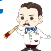
長崎大学病院キャラクター 「ポンペ先生」

<マイナンバーカード（マイナ保険証）でできること> 本院はオンライン資格確認を行う体制を有しています